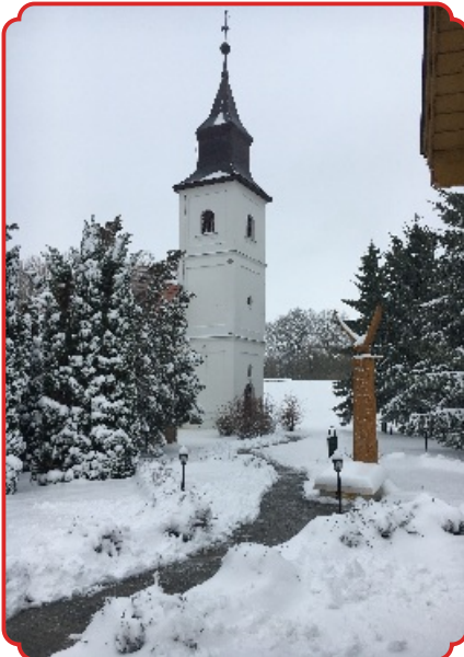
Tél a tavaszban – március 18. Sándor nap