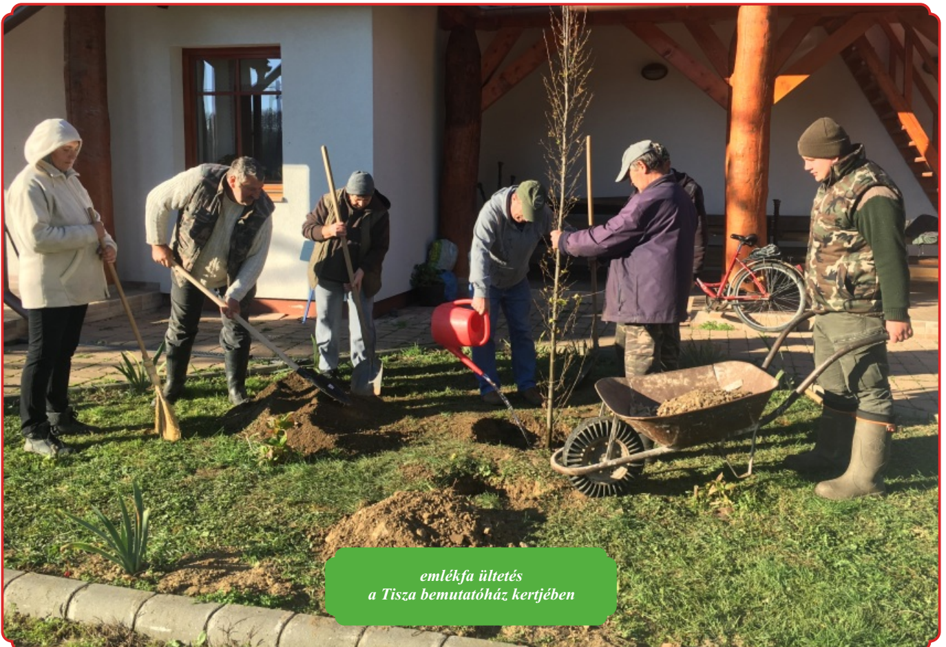
emlékfű ültetés a Tisza bemutatóház kertjében