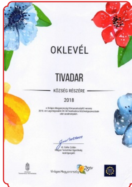
Virágos Mo. oklevél