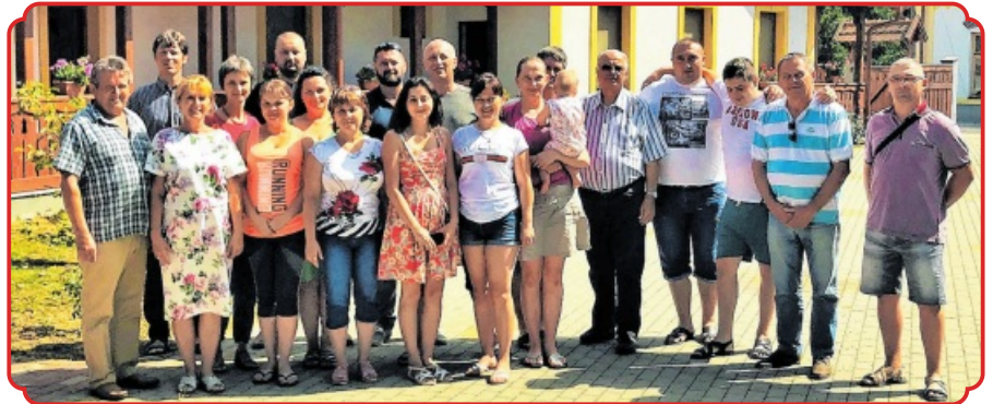
Élményekkel feltöltődve távoztak a kárpátaljai turisztikai szakemberek

A régi szoros szakmai együttműködést kihasználva a Turisztikai Tanács a Falusi Turizmus Szabolcs-Szat-