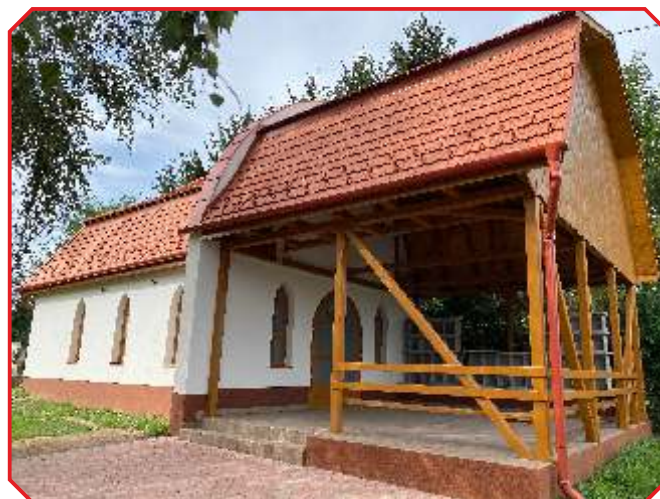
A ravatalozó a felújítás után.