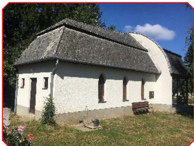
A ravatalozó a felújítás előtt.