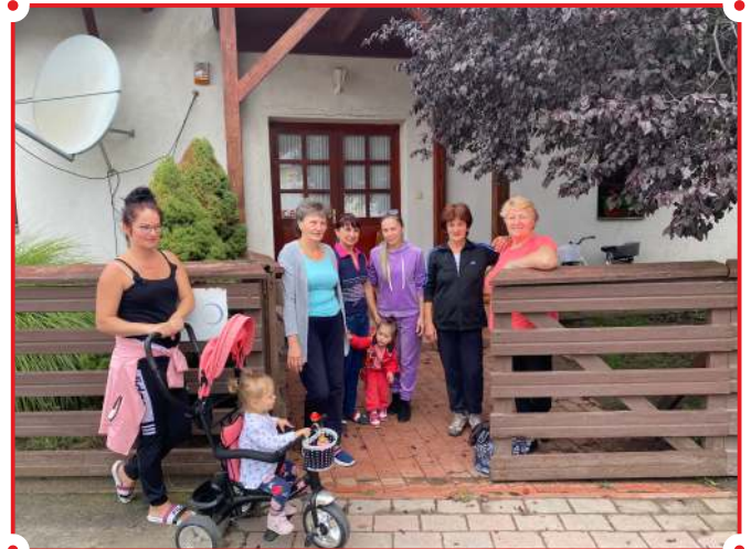
Nyári hangulatban – a református ifjúsági üdülő előtt