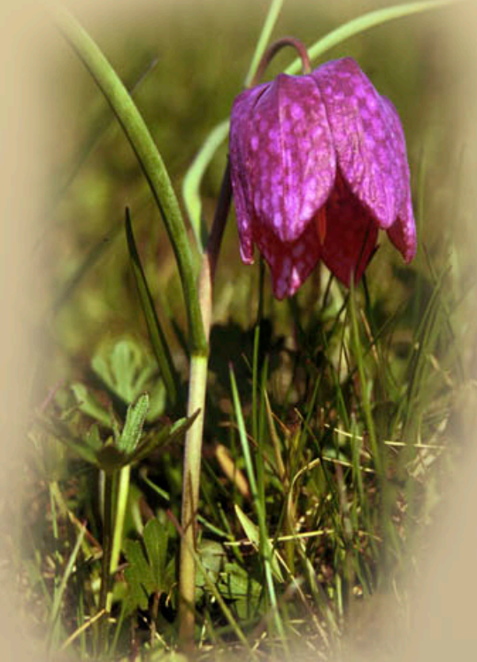
Kockás kotuliliom