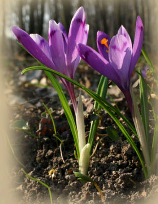
Kárpáti sáfrány

A fajgazdag cserjeszint mellett, kiemelkedő a ritka, védett fajokban bővelkedő gyepszint. Leginkább jellemző a kárpáti sáfrány, a kapotnyak, a kockás kotuliliom, a tavaszi tözike, és a csillagvirág. Ne felejtsük meg azonban az avar között megbújó állatokról sem, hiszen bármikor összetalálkozhatunk keresztes viperával, vagy elevenszülő gyíkkal. A Beregi erdők fajgazdagsága a Kárpátok közelségének és a változatos élővilágnak köszönhető.